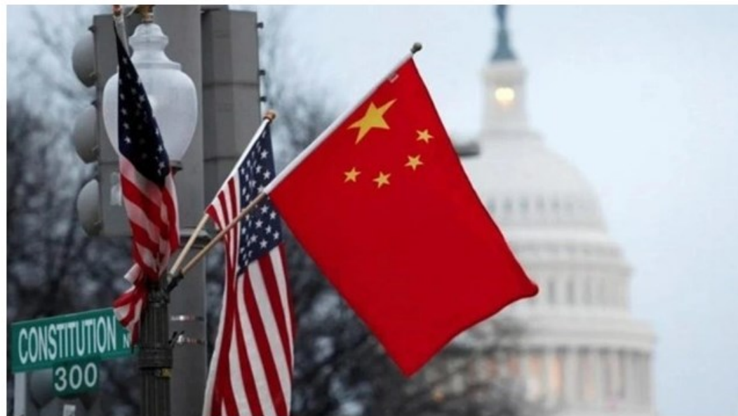
Mỹ cân nhắc khả năng dỡ bỏ một số loại thuế quan đối với Trung Quốc. (Ảnh minh họa)

Trả lời câu hỏi về thâm hụt thương mại của Mỹ với Trung Quốc, Shu cho biết Trung Quốc chưa bao giờ cố tình tìm kiếm